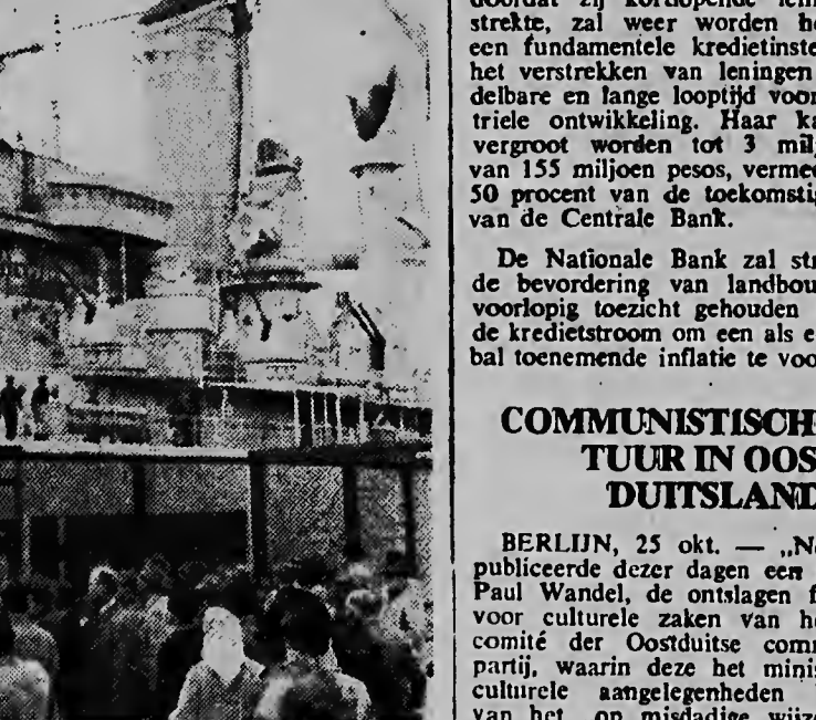
De Nederlandse kruiser „De Zeven provinciën” brengt op het ogenblik een bezoek aan Hamburg. De foto toont het indrukwekkende schip in de Hamburgse haven.